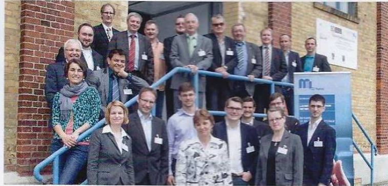
Mitglieder des Laundry Innovation Network während der letzten Marburger Logistiktage in 2014.

Im Rahmen der 20. Magdeburger Logistiktage (24. und 25. Juni 2015), die gemeinsam vom Fraunhofer IFF und der OVGU-Magdeburg ausgerichtet werden, finden nunmehr zum zweiten Mal am 25. Juni der LIN-Workshop unter dem Motto: „Wäscherei der Zukunft – Technologien, Menschen, Produkte“ statt.